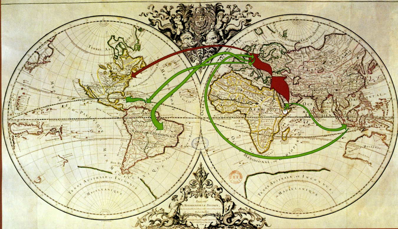
DOPPIO VIAGGIO. Oggi il caffè è coltivato in ampie zone dell'Africa, dell'America Latina, dei Caraibi e del Sudest asiatico, dove è stato introdotto dall'Africa tra la metà del XV secolo e l'inizio del XVIII. Le frecce verdi mostrano i viaggi che la pianta ha compiuto in quel periodo verso gli attuali luoghi di produzione; le frecce rosse mostrano invece il percorso di diffusione della bevanda.

particolari benefici da una così ampia diffusione geografica. L'uniformità genetica delle nuove coltivazioni è stata poi ulteriormente esasperata dal fatto che C. arabica è autoimpollinante, o autogama, caratteristica che, nell'intero genere, condivide solo con altre due specie. Tutte le rimanenti specie sono invece allogame, cioè necessitano di impollinazione incrociata, cosa che ne aumenta le possibilità di differenziarsi geneticamente.