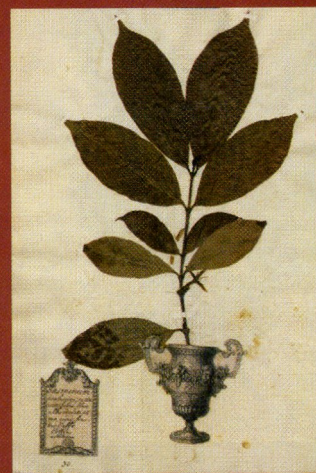
LINNEO USÒ QUESTO CAMPIONE di caffè essiccato per descrivere la specie nel suo Hortus cliffortianus , del 1738. Il grande botanico svedese trascorse due anni a documentare le piante di caffè che si trovavano nella proprietà del direttore della Compagnia delle Indie Orientali.

Dal punto di vista commerciale, l'unità di misura usata per il caffè sono i sacchi da 60 chilogrammi. Nel 2006 i produttori più importanti sono stati il Brasile (42 milioni di sacchi), il Vietnam (circa 15 milioni) e la Colombia (circa 12 milioni). Brasile e Colombia sono i principali produttori di C. arabica , mentre C. canephora è coltivata principalmente in Brasile e in Vietnam. Sui mercati mondiali, C. arabica ha prezzi più alti di C. canephora per la sua presunta superiore qualità, benché si tratti più che altro di preferenze dei consumatori: recentemente il prezzo medio per C. arabica verde (non